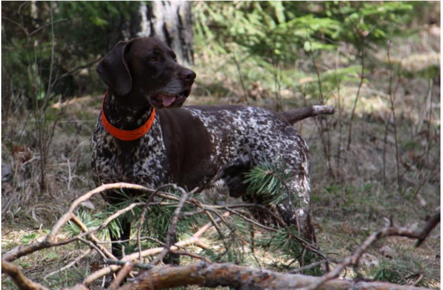
Šāds kurchāra apmatojums – jaukts balti brūns ar brūnu galvu – ir īsts “maskēšanās tērps”, kas ļauj sunim burtiski saplūst ar apkārtni.

bos; visplašāk kurchāri ir pārstāvēti Latvijas Medību suņu klubā (LMSK), kas ir Latvijas Kinoloģiskās federācijas biedrs.